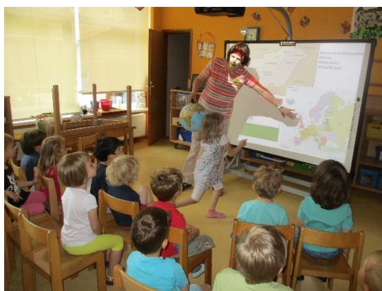
Mama predstavi Madžarsko