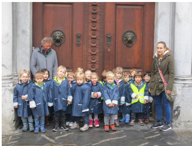
Pred Mestnim muzejem