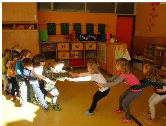
Ali je kaj trden most