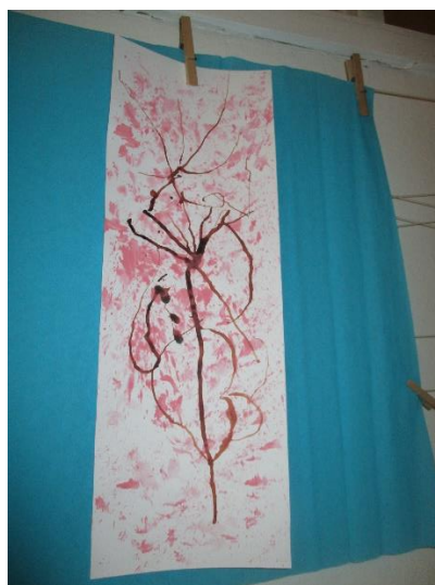
Zapisala: Monika Brodarić