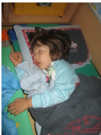
Spanje v vrtcu