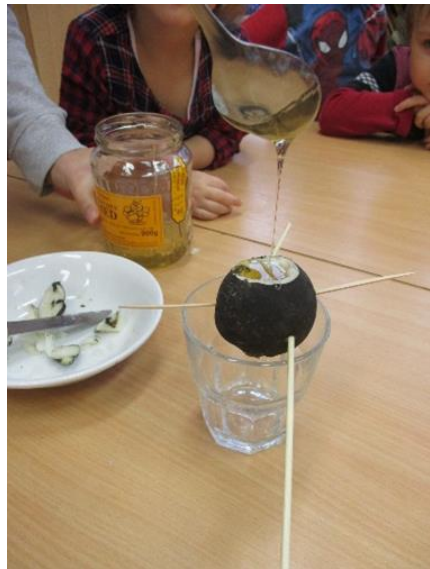
Priprava napitka za lajšanje kašlja