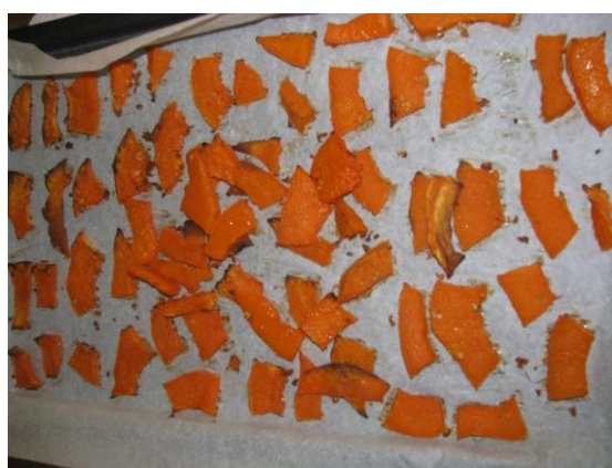
Priprava buče za noč čarovnic