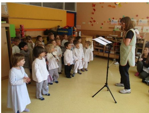
Petje ljudskih plesov