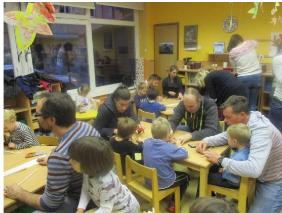
Delavnica s starši, starimi starši-izdelava novoletne dekoracije iz lesa