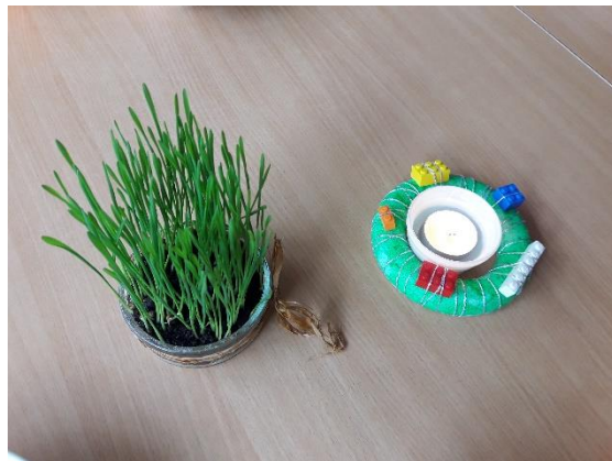
Sajenje božičnega žita