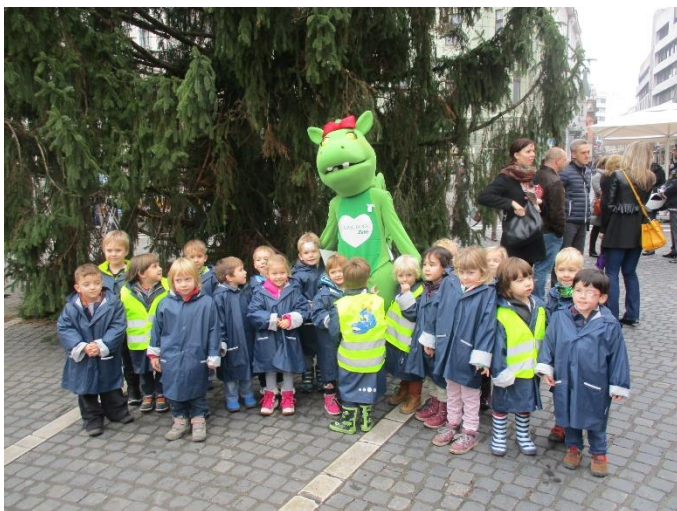
Slikanje z maskoto Ljubljane