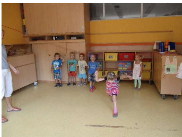
Skakanje, tek pod, čez kolebnico sodelovanje

Pri spoznavanju Slovenije smo se igrali tudi ljudske igre.