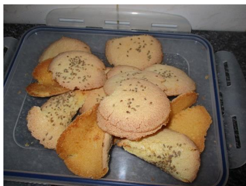
Priprava janeževih upognjencev