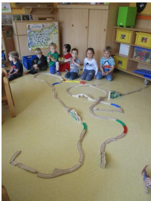
Najdaljša železniška proga