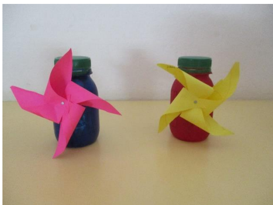
Nizozemski mlini na veter