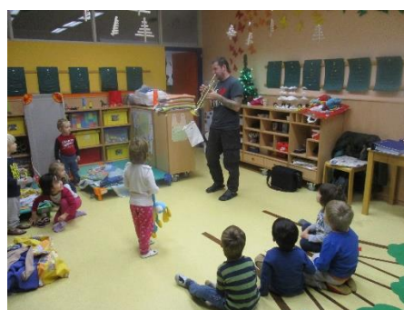
Bujenje s trobento