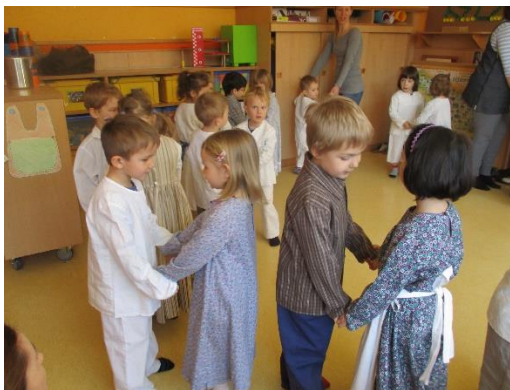
Ljudski plesi v narodnih nošah